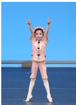
くすみ割り人形『中国の踊り』