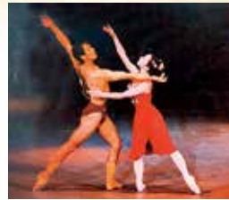
「ワルブルギスの夜」