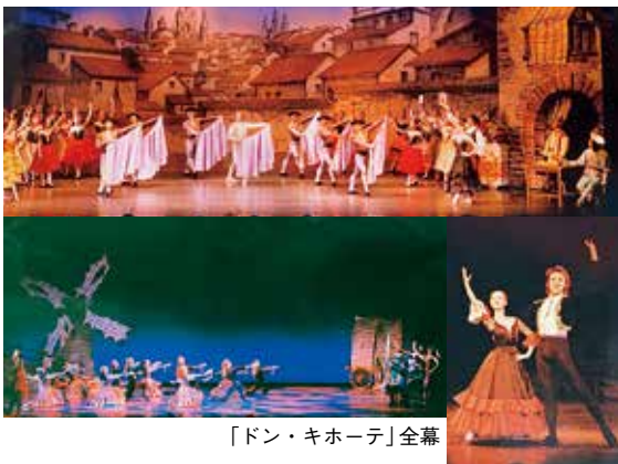
「ドン・キホーテ」全幕