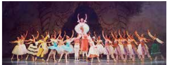
「くるみ割り人形」全幕