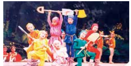
「白雪姫と森の動物たち」