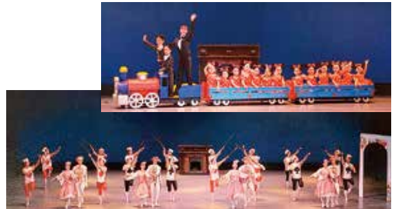
「ディズニーメドレー」