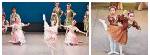
「白雪姫と森の動物たち」