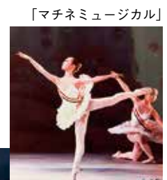
「マチネミュージカル」